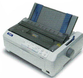
見出しシール用プリンタ