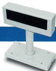
カスタマディスプレイ