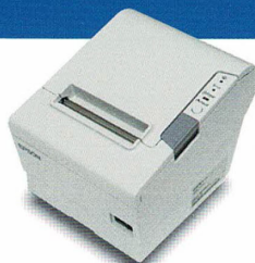
伝票用サーマルプリンタ