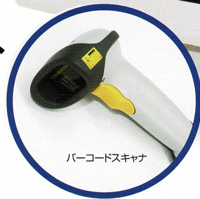
バーコードスキャナ